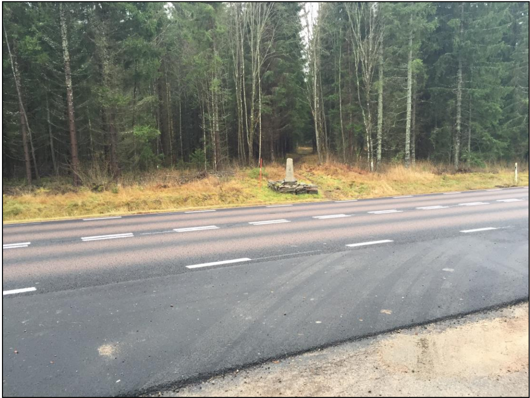
Figur 2. Fornlämning Alster 19:1 med del av äldre vägsträckning.