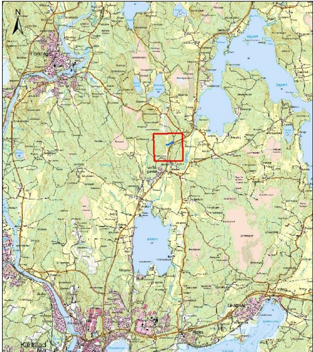
Figur 1. Utredningsområdet ligger inom det rödmarkerade området. ©Lantmäteriet. Ärende nr MS2005/01156.

På uppdrag av GeoPro AB i Jönköping har personal från Värmlands Museum utfört en kulturmiljöutredning inför en planerad väg som är tänkt att leda fram till en planerad bergtäkt nära Alstrum i Alsters socken, Karlstads kommun, Värmland. Utredningen utfördes 23 november 2016.